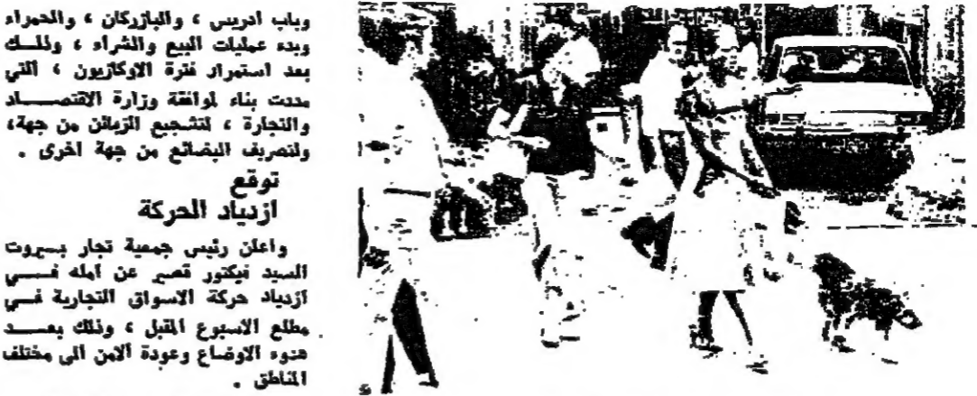
حركة عادية في شارع ويداغ

استعادت الحركة الاقتصادية في بيروت والمناطق جديدا نشاطها في مطلع الاسبوع، بعد مرور ثلاثة ايام من الهدوء واستقرار الامن، ويتوقع ان يعود النشاط الاقتصادي ويشمل جميع القطاعات كالصناعة، وابتداء من غد الاثنين، باستثناء المؤسسات التي تعرضت مباشرة للضرر خلال الاحداث الاخيرة. وبلغ حجم المبادلات خلال الاسبوع الماضي، 1975، بمبلغ 765000 ليرة، وهو يعادل ما سجلته الاسبوع قبل الاسبوع، وقد ساهمت المبادلات الخارجية في ارتفاع المبادلات، حيث بلغ حجم المبادلات مع الخارج 270000 ليرة، بينما بلغ حجم المبادلات المحلية 495000 ليرة. وتعتبر الازمة التي شهدتها المنطقة في امس، واحدة من حادة شهدت في شارع ويداغ، حيث تجمعت سيارات كثيرة في الشارع، مما اضطر السائقين الى التوقف عن السير.